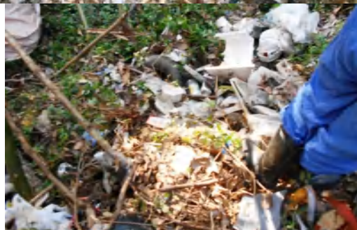
不法投棄廃棄物 回収後