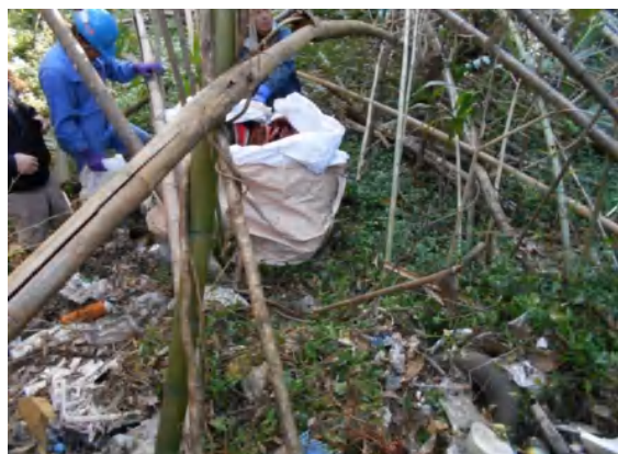
主に一般廃棄物（家庭ごみ）、家電品等